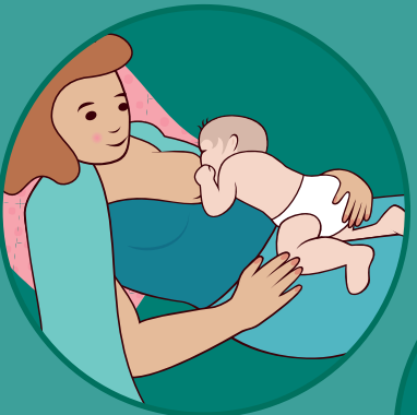
Pozicioni me shpinë të mbështetur